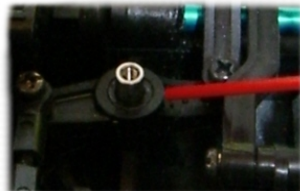
ステアリング部の潤滑