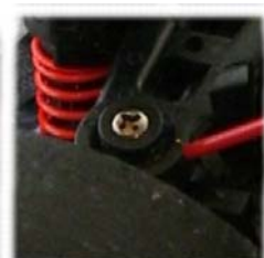
アッパーアーム部の潤滑