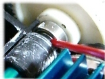
ベアリング部の潤滑