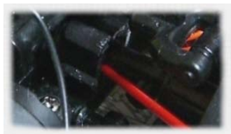
アーム接続部の潤滑